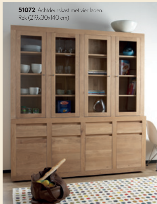
51072. Achtdeurskast met vier laden. Rek (219x30x140 cm)