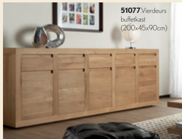
51077. Vierdeurs buffetkast (200x45x90cm)