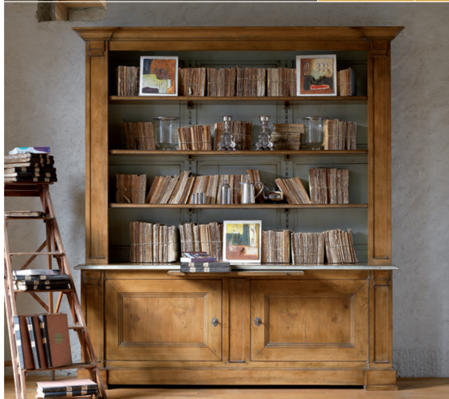
Bibliothèque Vendôme 1342 (202x220x50cm)