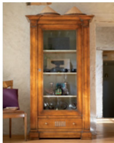
Vitrine Vendôme 1333 (110x52x200cm), étagères montées sur crémaillères, porte vitrée, un tiroir.

La collection Vendôme exprime parfaitement l'habileté des artisans d'Artcopi, un atelier situé dans le bocage vendéen. Il suffit d'effleurer ce mobilier du bout des doigts pour réaliser qu'il a été créé par des ébénistes respectueux des grandes traditions. A l'image des tiroirs, toujours assemblés selon la technique ancestrale de la queue d'aronde.