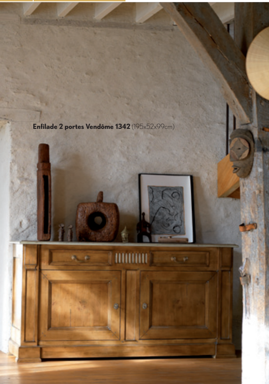
Enfilade 2 portes Vendôme 1342 (195x52x99cm)