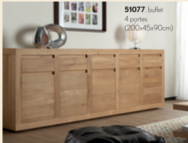
51077. buffet 4 portes (200x45x90cm)