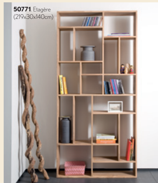
50771. Etagère (219x30x140cm)