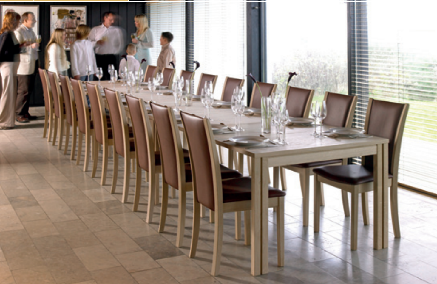
Table SM71 , buffet SM753 , chaise SM59 . Finition placage ou massif en chêne, wengé, noyer, hêtre ou merisier. Table de 109x190 (290cm avec allonges)